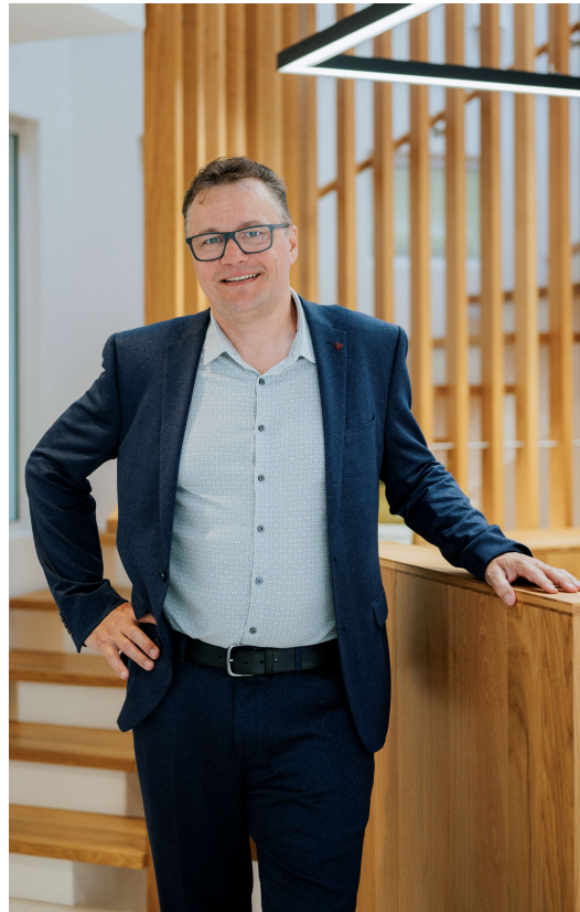
Hermann Schachtler Auftragsbearbeitung / AbaReport / Business-Process-Engine / Tools